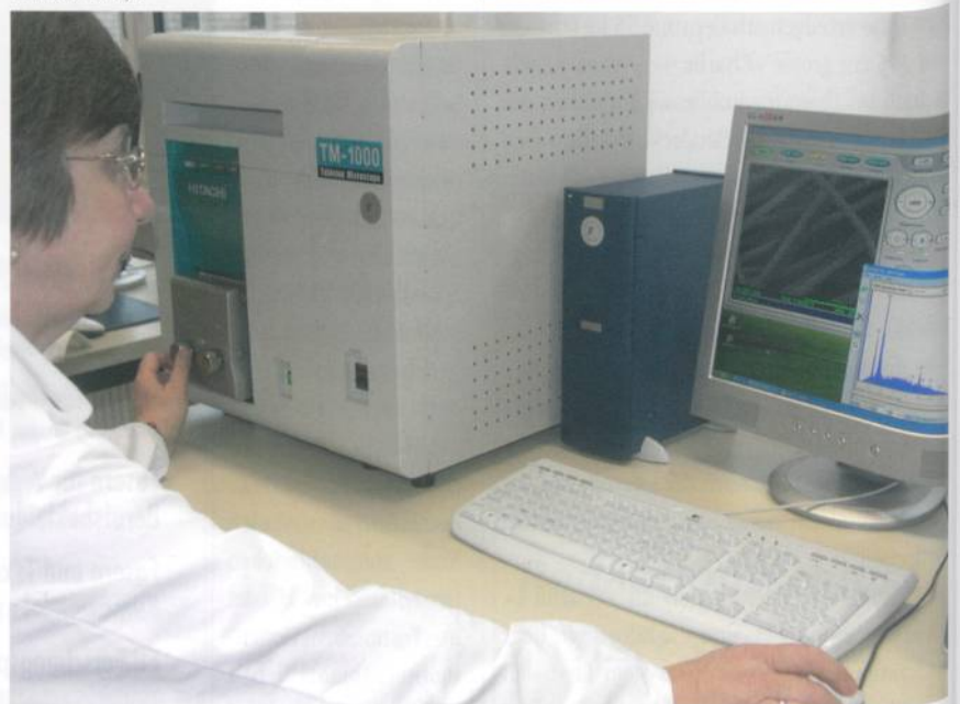
Abb. 1: Röntgenfluoreszenz-Analyse