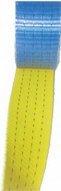
Band, gefärbt mit Ultraschall-Technik

liegen. Dabei wird mit Frequenzen zwischen 20 und 35 kHz gearbeitet. So kennt man zum Beispiel das Ultraschall-Schweißverfahren mit rotierender Sonotrode, um mehrere textile Flächen miteinander zu verschweißen. Dabei wird das Schweissgut erhitzt, plastifiziert, unter Druck verbunden und abgekühlt.