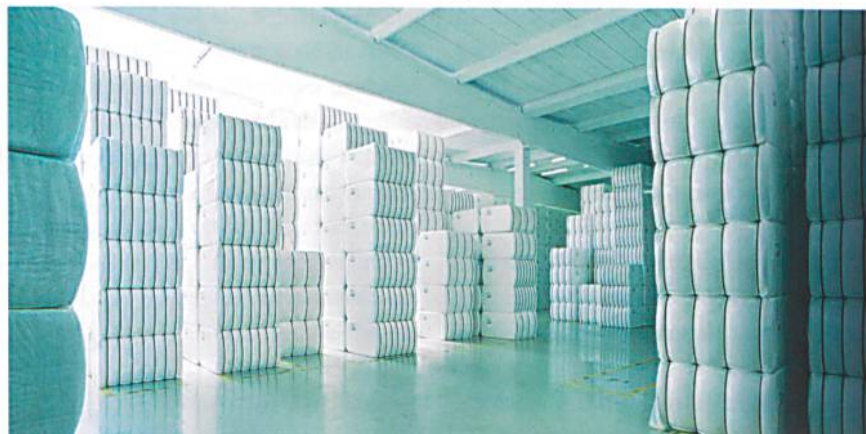
RZ-Ballenlager bei der Firma LENZING AG

Cellulosefasern können bis zu 70% des Eigengewichtes an Wasser aufnehmen, ohne dass sie