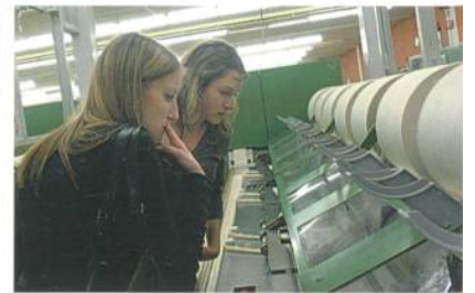
Hermann Böhler AG: hochwertig gesponnene Baumwollgarne

um bei den jungen Leuten für die Schweizerische Vereinigung Textil und Chemie SVTC zu werben, welche im Moment rund 600 Mitglieder zählt. Mit der Schweizerischen Vereinigung von Textilfachleuten SVT will man künftig noch näher zusammenrücken und gemeinsame Projekte, wie die NEXT, fördern. Denn letztlich verbinden beide Verbände, «die Trockenen (SVT) wie die Nassen (SVTC)», dieselben Ziele.