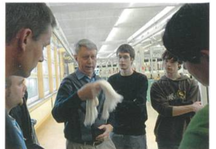
Hermann Böhler AG: Die Unterschiede zwischen gekämmten und nicht gekämmten Streckbändern sind deutlich sichtbar

Ein grosses Dankeschön geht an die beiden Firmen Christian Eschler AG und Hermann Böhler AG, dafür, dass sie sich heute die Zeit für die Nachwuchskräfte der Branche genommen haben.