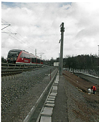
Abb. 5: Test an der Bahnstrecke Dresden-Nürnberg

grierten optischen Polymerfasern als Sensoren bestanden, konnten verschiedene Prototypen erfolgreich auf deren Eignung getestet werden. Bei den sensitiven Netzstrukturen erfolgte dies einerseits mit kostengünstigen, neuentwickelten Messgeräten zum Auslesen der Messsignale, um die Vorzüge der optischen Polymerfasern zu unterstreichen – andererseits durch Dehnungsmessungen mittels optischer Rückstreuungstechnik im Zeitbereich (OTDR, engl. optical time domain reflectometry), die eine genaue Lokalisierung sowie quantitative Abschätzung der Deformation ermöglicht. Das einfache Sensorsystem ist mechanisch robust und reagiert erst auf gravierende Schädigung oder Zerstörung des Textils, die Sensorfasern sind nahezu unsichtbar ins Textil integriert, die Handhabung der Sensoren ist einfach und preisgünstig. Demonstratoren der sensitiven Netzstruktur wurden erfolgreich getestet und liegen vor.