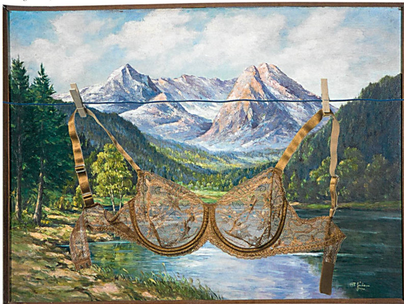
Abb. 2: Das Teilchen zum Halten, Formen und Verzaubern wurde auf einer Textronic® Lace vom Typ TL 43/1/24 gefertigt

Hinsichtlich Effizienz, Qualität und Handling profitieren die JL 73/1 und die JL 83/1 von den Vorteilen des Einsatzes der neusten Technologie aus dem Hause KARL MAYER. Hier zu nennen: von Servomotoren angetriebene Musterlegebarren, elektronischer Warenabzug, elektronische Warenaufrollung und eine moderne Bedienoberfläche mit Touchscreen.