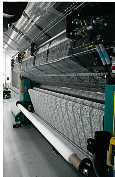
Abb. 1: Frontansicht der JL 83/1

Die variable Versatzlinienkonfiguration macht es dem Kunden möglich, unterschiedliche An-