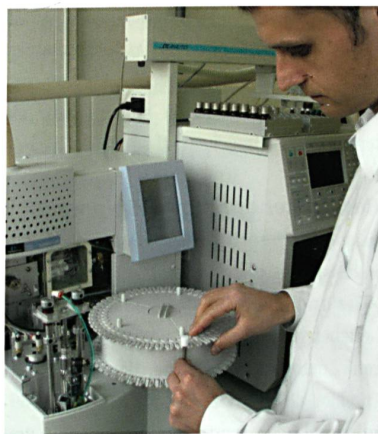
Abb. 2: Qualitativer und quantitativer Nachweis von Geruchssubstanzen auf Werkstoffen und Textilien mittels Gaschromatograph mit Massenspektrometer

In einer zweiten Untersuchung belasten Probanden in einem kontrollierten Trageversuch Textilien mit echtem Körperschweiß. Speziell geschulte Testpersonen bewerten anschließend qualitativ und quantitativ die Geruchsreduzierung der antimikrobiellen Materialien im Vergleich zu herkömmlichen Textilien.