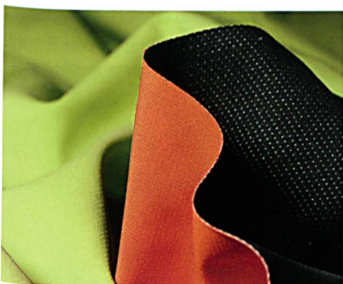
Abb. 1: soft-shells mit Rippenstruktur

Strukturierte Oberflächen, die im Look an einen Golfball erinnern, werden bestimmt nicht nur auf der Driving Range für Furore sorgen. Als superleichte soft-shells – mit Laminat oder Mesh auf der Rückseite – bieten die Polyamidgewebe z. B. in sportlichem Provence-Blau oder saftigem Orange den gewohnt bi-elastischen Wohlfühlkomfort. Der witzige 3-D-Effekt überrascht auch bei der etwas kompakteren, schaumbeschichteten schoeller®-WB-400 Jackenqualität z. B. in Schwarz mit leuchtend roter Innenseite.