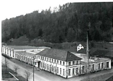
Die Weberei um 1940

Qualität anzubieten. Mut und Innovationsgeist bewies Schlossberg Switzerland mit Bettwäsche, die bunt bedruckt war. Diese drei Neuerungen machten die Marke aus Turbenthal rasch zur Nummer 1 auf dem Schweizer Markt. Die Marke Bonjour Switzerland war zuerst für das hochwertige Frottierprogramm bekannt, später folgte auch Bettwäsche mit Dessins, die berühmte Künstler wie Jean Tinguely, Harald Naegeli oder Peter Greenaway eigens für Bonjour Switzerland entwarfen.