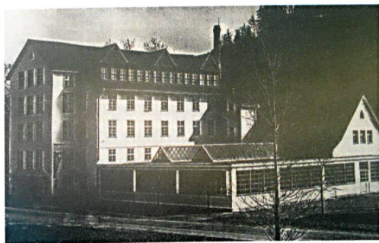
Der 1833 erbaute Spinnerei-Hochbau im Hintergrund

Merkmale von Schlossberg Switzerland. Bonjour Switzerland hingegen spricht mit seinen Produkten die junge, trendorientierte Kundschaft an.