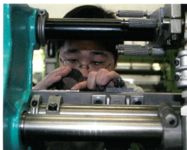
Abb. 4: Das Ausbildungs- und Trainingszentrum

Mit der Eröffnung der neuen Produktionsstätte KARL MAYER (CHINA) Ltd. gibt es nun auch in China eine KARL MAYER Academy. Das Ausbildungs- und Trainingszentrum für den asiatischen Raum gehört zur KARL MAYER China Ltd. und hat verschiedene, spezifische Wirkereikurse im Programm (Abb. 4). Die Lehr-