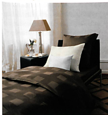
Dessin NOX Chocolat – Schlossberg Switzerland

Hochwertige Drucke und erstklassige Gewebequalität sind besondere Vorzüge, welche die anspruchsvolle Kundschaft der Schweizer Textilmarke schätzt. Der Sinn für das Schöne, die Wahl von natürlicher Baumwolle, erstklassiger Qualität von Garnen und Stoffen, einmalige Farbenvielfalt und Dessins, die von der Natur inspiriert sind, sind noch heute die