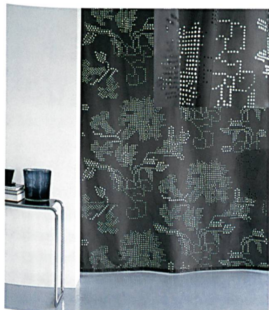
Abb. 2: Bei «Epunto» stellen die Experten von création Baumann ihr Können im Lasercut unter Beweis

das bisherige Sortiment. Die Stoffe verschönern die private Umgebung und verleihen Restaurants, Lounges und Hotels eine persönliche Note. Neben eleganten Unistoffen sorgen zeitlose Jacquard-Dessins in unterschiedlichen Farbwelten für mehr Emotionalität und Funktionalität im Raum. Die Stoffe in schwerentflammbarem, pflegeleichtem Trevira CS lassen sich wie im Baukastensystem nach Belieben zusammenstellen und erlauben zahlreiche Möglichkeiten, einen Raum zu gestalten. Zu den Besonderheiten gehört der markante Vorhang- und Bezugsstoff «Maria». Die Flächen der ineinander geschobenen Kreise sorgen bei dem zweifarbigen Stoff für eine spannende Tiefenwirkung. Neu ist auch «Velos», ein Trevira-CS-Velours mit aussergewöhnlich matter Oberfläche. Ein Bettüberwurf komplettiert die Kollektion: «Calma» bringt durch feine Nadelstreifen und dreidimensionale Rippenoptik Eleganz in den Schlafbereich.