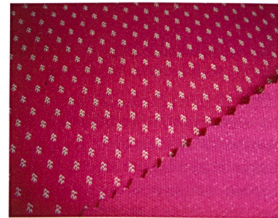
Abb. 2: Spacerknit mit Checkmuster und hydrophobem Finish

shell», eine 3-Lagen-Strickkonstruktion. Diese Abstandsgestricke verfügen über hervorragende Längs- und Quer-Elastizität, permanente wasserabweisende Ausrüstung, gute Windresistenz bei gleichzeitig ausgezeichneter Atmungsaktivität und Isolationsfähigkeit (Abb. 2). «Aktive Softshells» des Schweizer Maschenspezialisten werden für Outdoorbekleidung überall da eingesetzt, wo eine Membrane unnötig ist. Der