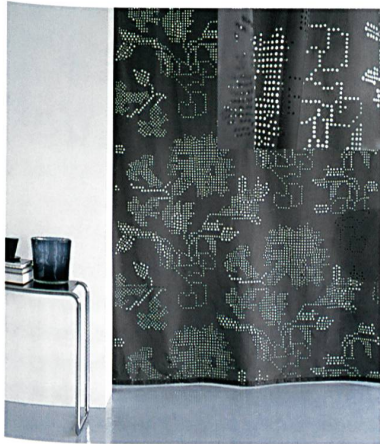
Abb. 2: Bei «Epunto» stellen die Experten von création Baumann ihr Können im Lasercut unter Beweis

das bisherige Sortiment. Die Stoffe verschönern die private Umgebung und verleihen Restaurants, Lounges und Hotels eine persönliche Note. Neben eleganten Unistoffen sorgen zeitlose Jacquard-Dessins in unterschiedlichen Farbwelten für mehr Emotionalität und Funktionalität im Raum. Die Stoffe in schwerentflammbarem, pflegeleichtem Trevira CS lassen sich wie im Baukastensystem nach Belieben zusammenstellen und erlauben zahlreiche Möglichkeiten, einen Raum zu gestalten. Zu den Besonderheiten gehört der markante Vorhang- und Bezugsstoff «Maria». Die Flächen der ineinander geschobenen Kreise sorgen bei dem zweifarbigen Stoff für eine spannende Tiefenwirkung. Neu ist auch «Velos», ein Trevira-CS-Velours mit aussergewöhnlich matter Oberfläche. Ein Bettüberwurf komplettiert die Kollektion: «Calma» bringt durch feine Nadelstreifen und dreidimensionale Rippenoptik Eleganz in den Schlafbereich.