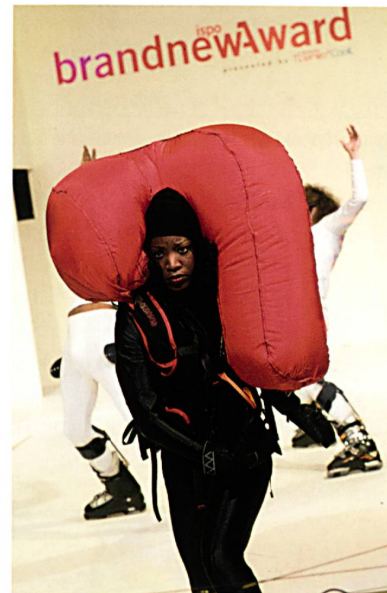
Abb. 3: Der Airbag für die Piste