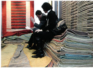
Abb. 10: Teppiche, Quelle: Messe Frankfurt Exhibition / Thomas Fedra

le oder geometrische Reliefdekore, die sich fast über die gesamte Teppichbreite erstrecken und bekommen so Bild-Charakter. Trotz der Mustergrosse wirken sie nicht laut, weil sie meist einfarbig gehalten sind. Insgesamt überwiegen grafische Dekors – Streifen, Quadrate, Kreise. Schachbrett-Dessins in zwei oder mehr Farben sieht man in vielen Kollektionen. Klassische Blütendessins werden modern modifiziert, hier und da auch mit strengen Streifen kombiniert. Die Farben sind wie bei den Stoffen zurückhaltend und angenehm unspektakulär – Aubergine, Graublau, Nougat oder Sand, aufgefrischt durch Dekore in Salbeigrün, Blassgelb oder Rosé.