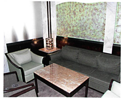
Abb. 2: Sitzgruppe aus flammfestem Polyester

Den Entwicklern von ADVANSA ist es gelungen, die flammhemmenden Eigenschaften von Securelle® mit der Funktionalität des Fleckschutzes Teflon® Stain Release Fabric Protector zu kombinieren. Die fortschrittliche Technologie von Securelle® und Teflon® ermöglicht die ideale Kombination von Sicherheit und Pflegeleichtigkeit. Die Ausrüstung macht Bezugs- und Vorhangstoffe noch hochwertiger: flammhem-