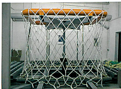
Prüfung eines Luftfracht-Sicherungsnetzes

Mit diesem Netzprüfstand ist die Bestimmung des Kraft-Dehnungs-Verhaltens grossflächiger und/oder konfektionierter, netzartiger Strukturen durch das Aufbringen einer Belastung senkrecht zur Ebene mittels geometrisch verschiedener Prüfkörper bis zu ca. 24 t möglich.