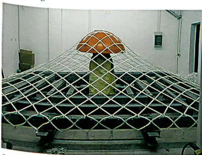
Prüfung eines aufgespannten Sicherungsnetzes mit Halbkugel-Prüfkörper

Mit Erreichen der erforderlichen «Reife» steht der akkreditierten Prüfstelle im STFI jetzt ein weltweit nahezu einzigartiger Prüfstand zur Verfügung.