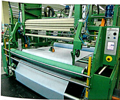
Abb. 3: Schnittoptimierung

«Die Kernfunktion der dreistufigen Arbeitsweise ist die Schnittoptimierung (Abb. 3). Die