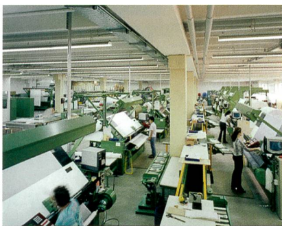
Abb. 1: Warenschauabteilung

Die Warenschau übernimmt die Endkontrolle der Warenqualität (Abb. 1), die Stückauf-