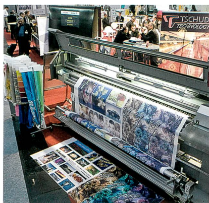
Tschudi Technology aus Wattwil auf der ITMA 2007 in München

haben hier eine fantastische Besucherqualität mit Leuten aus aller Welt erlebt – auch mit Top-Leuten, die man sonst nur ganz selten sieht. Wir sind wirklich hochzufrieden.»