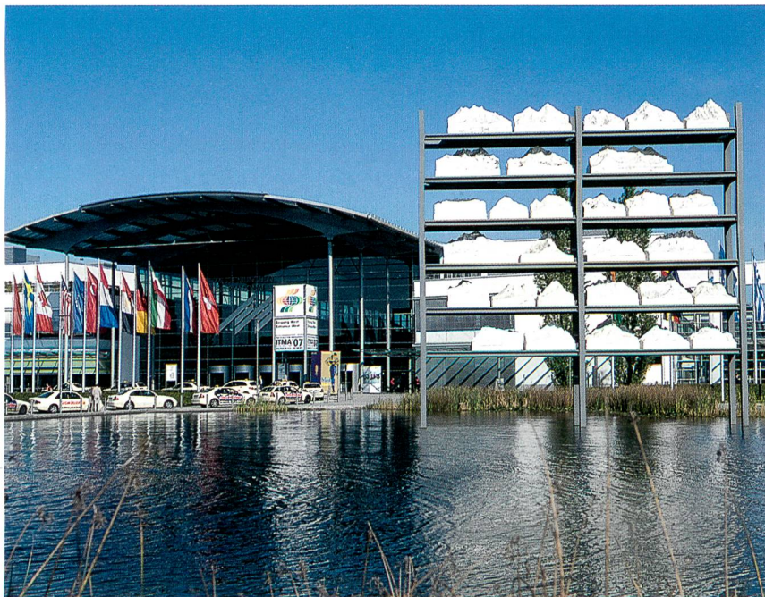
Eingang West mit Messesees; Foto: Alex Schelbert

«Munich is a location which is well-known. For me, Munich is the best location in Europe.»