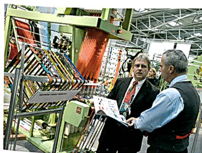
Fachdiskussionen am Stand; Foto: Alex Schelbert

«The visitors at ITMA 2007 were very international and specific. It was a good platform to establish new contacts. For us, ITMA 2007 was very successful. Moreover, the organisation was really very good.»