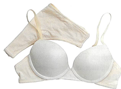
creora H-450 mit Bambusfasern

biologisch angebaute Baumwolle verarbeiten. Die niedrigere Temperatur bei der Stoffveredelung reduziert zudem die Energiekosten, den Ölverbrauch und somit auch die CO 2 -Emission. H-100D ist das schwarze Elastan von creora. Diese Faser reduziert den Verbrauch von Färb- und Veredelungschemikalien. Auch in Verbindung mit natürlichen Garnen wird die Nutzung von Färbemitteln und Wasser erheblich reduziert. creora H-350 spielt ebenfalls eine ökologisch wichtige Rolle, da es in Verbindung mit Polyester bei sehr hoher Temperatur eingefärbt werden kann. Bei diesen hohen Temperaturen