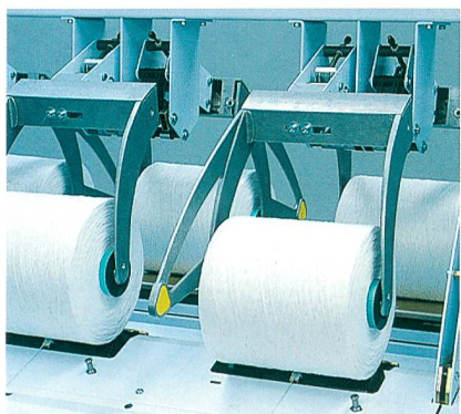
CarpetCabler – Spulenrahmen

genaue Einstellungen und gleichmässige Ablaufspannungen. Spannungsschwankungen im Garn werden durch zentral einstellbare Bremssysteme auf ein Minimum reduziert