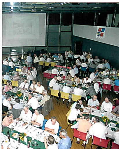
Gemeinsames Nachtessen der Vereine SVT und SVTC