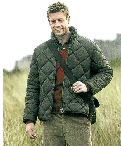
Neufundland Jacke von Barbour

Die britische Traditionsmarke Barbour hat Thermolite®, eine Marke für Funktionsstoffe und -fasern von ADVANSA, Europas führendem Polyester Produzenten, in die Herren-Bekleidungskollektion Herbst/Winter 06/07 aufgenommen. Thermolite® Isolations-Funktionsfasern sind allergieneutral und speziell entwickelt worden, um eine grösstmögliche Wärmeisolierung bei gleichzeitiger Leichtigkeit, Weichheit und Bauschvermögen zu gewährleisten.