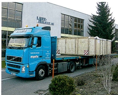
Abb. 1: Anlieferung der Anlage

Die moderne Kamera-Erkennung von eingewebten Rapporten respektive Mustern optimiert den Zuschnitt und erhöht zusätzlich die Massgenauigkeit der Textilien. Die Formen und Masse werden über ein CAD eingegeben, worin auch die Zuschnittoptimierung erfolgt, für eine maximale Ausnützung des Materials erfolgt. Die neue Maschine dient als Ersatz für die Maschine mit einer Schnittbreite von 2'200 mm.