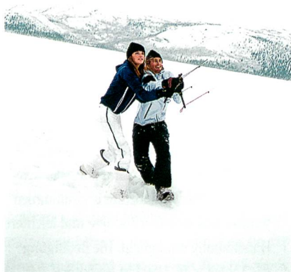
Schneespass mit Tommy Hilfiger und Sympatex