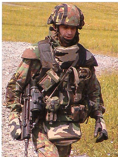
Passgenaue Prüfung von Kleidung für den militärischen Einsatz: die Simulations-Software M.A.C.A.O. von Telmat Industrie.

M.A.C.A.O. sowohl unbekleidete als auch voll bekleidete und ausgerüstete Personen anhand von deren anthropometrischen Daten und Körpermassen beschreiben. Mit Hilfe von Markierungen führt M.A.C.A.O. die Messungen vollautomatisch durch. Die Untersuchungen können im statischen und im dynamischen Zustand vorgenommen werden. Im letzten Fall charakterisiert das Messsystem einfache Bewegungen, wie Stehen, Auf-dem-Bauch-Liegen, Sitzen und reflexartige Bewegungen. Die Tests bewerten die physikalischen Belastungen der Kleidung hin-