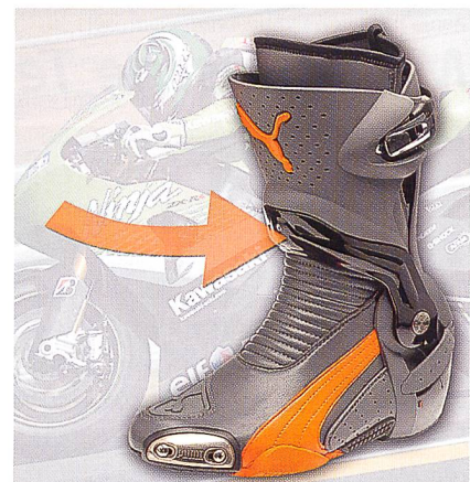
Abb. 2: Hochleistungs-Motorradstiefel von Puma