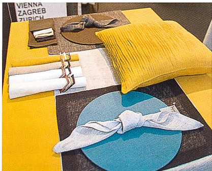
Abb. 3: kitchen & culture