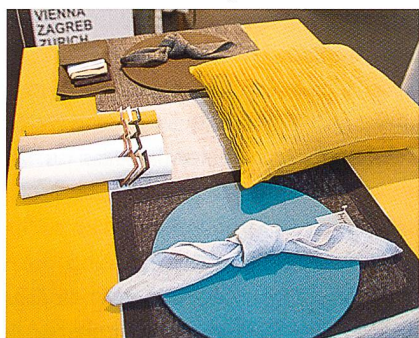
Abb. 3: kitchen & culture