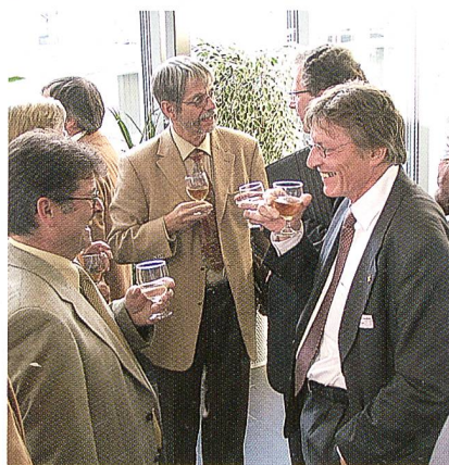
Angeregte Diskussionen beim Apéro

Alle werden in Globo mit einem kräftigen Applaus bestätigt, respektive neu gewählt.