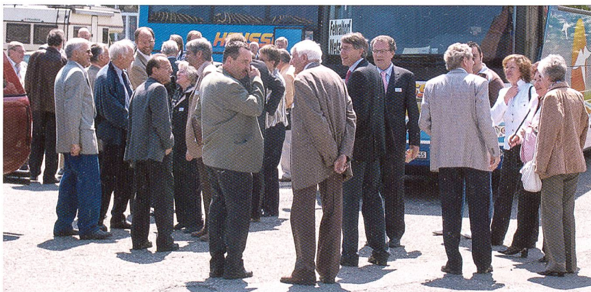
Besammlung für die Betriebsbesichtigungen