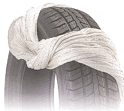
Reifen mit Reifencord

beim Vornetzen von Baumwollgarnen bis zu 50 Prozent an Schlichtemittel.