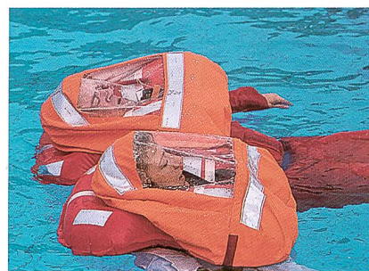
Abb. 2: Das wasserdichte und gasdurchlässige GORE® SEA Funktionstextil für Sprayhoods von Rettungswesten schützt Schiffbrüchige vor Gischt und Überflutung. Andererseits ist es gasdurchlässig und erlaubt erstmals, das Atmen in einer vollkommen abgeschlossenen Schutzhaube, bei der auf nachteilige Lüftöffnungen verzichtet werden kann..

Ob bei der Sport- oder zivilen Berufsschiffahrt oder bei Marine-Streitkräften, eine der grossen Gefahren für Schiffsbrüchige auf hoher See ist das Erstickten an Gischt. Spritzschutzhauben (Spray Hoods) für Rettungswesten können diese Gefahr zwar verhindern, besitzen jedoch einen entscheidenden Nachteil: Um das, für das Atmen unter der Haube erforderliche richtige Verhältnis von Sauerstoff- und Kohlendioxidanteilen sicherzustellen, benötigen sie Lüftungs-