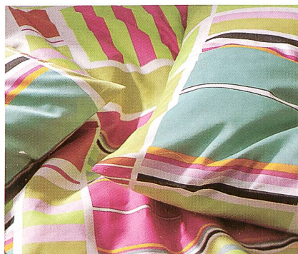
Bonjour of Switzerland

Swiss Twill Collection® heisst die junge, trendige Kollektion von Bonjour of Switzerland