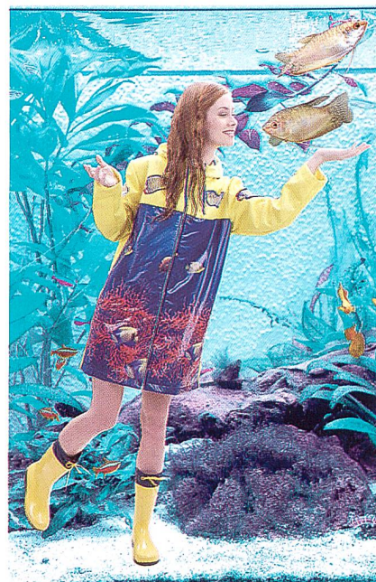
Drei-Lagenlaminat für Regenbekleidung

goldgelber Fische in blutroter Korallenlandschaft sorgt diese Wetterschutz-Ware für Farbe im Regengrau und gute Laune beim Betrachter. Unterstützt wird dies vom Sonnengelb des Materials an den Ärmeln und auf der Mantelrückseite. Das hierfür verwendete Laminat wurde speziell für den Einsatz in Sportbekleidung hergestellt und kombiniert drei funktionelle Schichten: eine Kettenwirkware mit einer gezielt atmungswirksamen Musterung auf der Aussen-seite, eine atmungsaktive, wasserabweisende Membran darunter und eine leichte Meshware zu deren Schutz auf der Innenseite. Die Wirkwaren wurden jeweils auf einer HKS 3-M hergestellt – mit einer EBA 2-Step Modifikation für die Deckware. Die Verbindung des Textilmaterials mit der mikroporösen Membran erfolgte durch das Point-in-Point-Verfahren der Firma