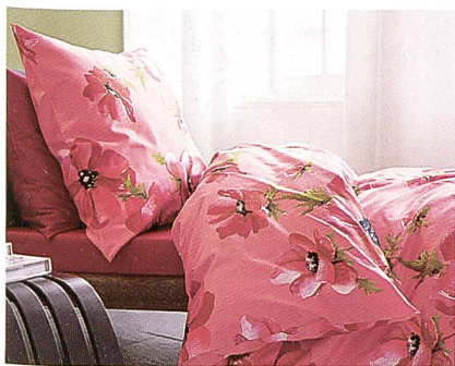
Schlossberg Textil AG

Strandtage. Inspiriert am aktuellen Retro-Style-Thema, lassen wir das «Savoir Vivre» des berühmten Küstenstreifens zwischen Cannes, Nizza und Monte Carlo aufleben.