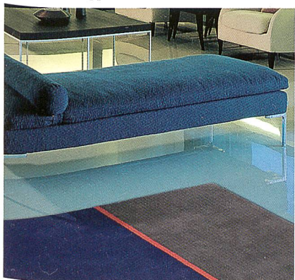
Tisca Tischhauser &amp; Co. AG

Tisca Teppiche ist ein Schweizer Familienunternehmen, das seit 60 Jahren seinen Firmensitz im Kanton Appenzell Ausserrhoden hat. Der