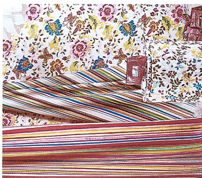
smart und trendy – das Horn-Coordinate «Disco»