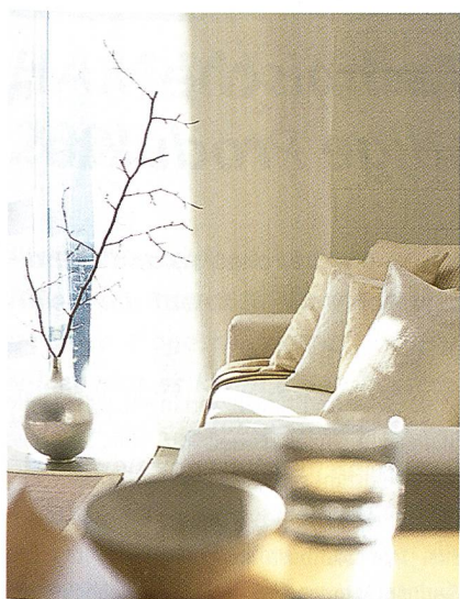
Von Baumwollgewebe über edle Seidenstoffe bis zum schweren Leinenstoff

Nun wird das erfolgreiche Programm aus Raff- und Flächenvorhängen, Lamellen und Rollos um eine Serie neuer Vertikallamellen ergänzt – von sachlich bis verspielt. Die Erweiterung der Kollektion setzt auf Formen, Linien und Effekte. Sie umfasst dabei zum einen die Weiterentwicklung von Klassikern, zum anderen Neuentwicklungen in Druck-, Häkel- und Prägetechnik. Bei den Klassikern ist neu «Erato II» in 15 Farben erhältlich: Den halbtransparenten Stoff gibt es nun auch in kräftigeren Farben sowie in zweifarbiger Ausführung. Der etwas dichtere Stoff «Pado II», bisher nur in