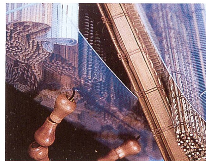
Die neue Rollo-Kollektion; eine Vielzahl attraktiver Bambus- und Holzgewebe

Eine technische Finesse im Massprogramm Plexipaneele ist das neue Schienensystem, das individuelle Einsatzmöglichkeiten erschliesst. So ist z.B. eine Montage von Wand zu Wand problemlos möglich. Die Plexipaneele sind in jeder individuellen Farbe lieferbar und als Flächenvorhang oder auch als Raumteiler im privaten, wie auch im Objektbereich einsetzbar.