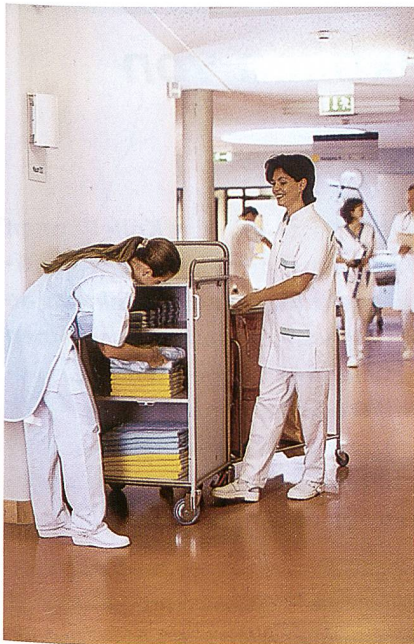
Abb. 1: funktionelle Proact® Maschenstoffe

ten aus Trevira Bioactive an. Diese antimikrobiellen Workwear-Materialien sind für den medizinischen Bereich konzipiert, denn vor allem im Gesundheitswesen besteht die Forderung nach infektionspräventiven Textilien für Schutz-, Pflegepersonal- und Patientenbekleidung (Abb. 1). Hohen Tragkomfort verspricht die Atmos® Piqué-Qualität aus antimikrobiellen Trevira Garnen. Neben der Anwendung im Krankenhaus- und Pflegebereich können antimikrobielle Textilien bei der Lebensmittelher-