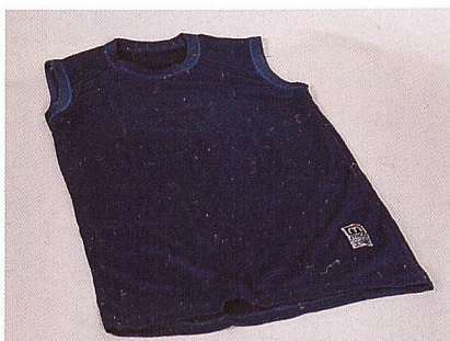
Abb. 3: Coolmax® im Maschenwarenbereich

Folgende Bekleidungshersteller haben Coolmax® Stoffe in ihren Kollektionen für diese Saison und für die Sommerkollektion 05 mit aufgenommen: