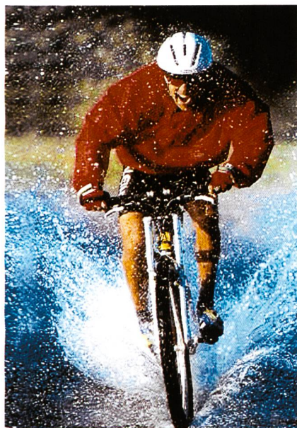
Abb. 1: Biker in action

Eschler/T.M.F. zeigten erstmals diverse Bikepolster aus dem Polyester-garn Trevira «Bioactive», welches eine permanent antimikrobielle Wirkung ohne Einsatz von Chemie sichert. Für Hosenpolster ein enormer Vorteil, wenn man an den intensiven und direkten Hautkontakt denkt. Neue Verarbeitungs-Technologien ermöglichen zudem die Erweiterung der 4-Way-Pad Produktpalette, die nahtlose Verarbeitung unterschiedlicher Qualitäten, Farben und Schaumhärten zu einem Polster, sowie die