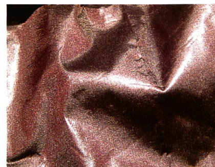
Abb. 1: Neue metallische Oberflächen

Bei der shape-collection nimmt sich Schoeller die Natur zum Vorbild: Entstanden sind technisch hoch anspruchsvolle Nachbildungen von Schlangenhautmustern und andere feine Stoffstrukturen, die Bilder aus der Natur imitieren. Die elastischen und unelastischen Stoffe eignen sich für Hosen und Jacken. Andere shape-Neuheiten setzen softe und elegante Akzente durch Velours-Innenseiten; dazu kommen edles Baumwolldesign sowie interessante Bi-Color- und Denim-Strukturen.