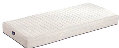
«Privilège» – ein neuartiges Schlafgefühl

Der modulare Aufbau der «Privilège» ermöglicht erstmals eine genaue Anpassung der Matratze an individuelle Kundenbedürfnisse. Der Kunde kann über den Basiskern den Komfort und über die auswechselbaren Auflagen das Klima seiner Matratze selbst bestimmen. Die einzelnen Auflagemodule ermöglichen auch eine einfache Reinigung. Zudem kann den verändernden Bedürfnissen des Kunden an das Schlafklima durch eine andere Auflage schnell und günstig Rechnung getragen werden. Solche Möglichkeiten bestanden bei den herkömmlichen Matratzendesigns nicht.