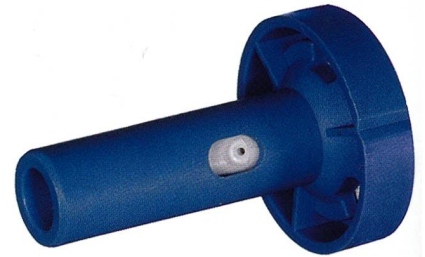
HemaJet® Düsenkern T 311-2 K2 (R)

Variante 2: Mitteltitergarn für Sport- und Freizeitbekleidung