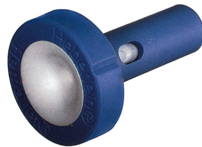
HemaJet® Düsenkern T 311-2 K2 (L)

Die Serie A ist jedoch auf Grund der deutlich höheren Luftstromgeschwindigkeit wesentlich flexibler bezüglich Filamentfeinheit und Materialdichte (z.B. Polypropylen).