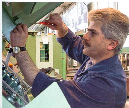
Montage von Kämmeremaschinen im thurgauischen Werk Sirmach von Rieter Textile Systems

Vor dem Hintergrund der schwachen Marktvorfassung hat sich Automotive Systems gut be-