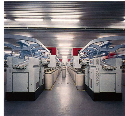
Abb. 3: FANCYNATION – zur Herstellung von Effektgarnen

Die Basis bilden der von Picanol, Weave Up entwickelte Luftindextester (Air Index Tester AIT) und der neue Autocoro 360 von Schlafhorst. Der AIT simuliert den Schusseintrag und misst die Eintragungsgeschwindigkeit des Garns und deren Variation. Der mit dem AIT ermittelte Luftindex (LI) beinhaltet zum einen Informationen über die maximal mögliche Schusseintragsgeschwindigkeit, und damit über die Maschinenproduktivität, und zum anderen über den erforderlichen Luftdruck an der