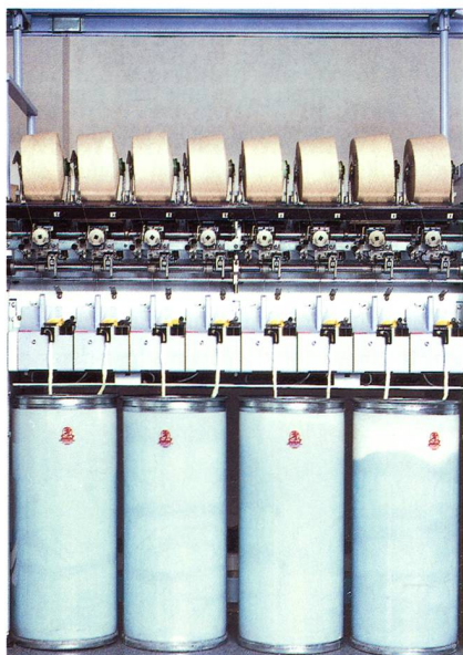
Abb. 1: Electronic Vacuum Adjustment (EVA) – die innovative Spinnunterdruckregelung für die BD-Reihe

Rotorspinnmaschinen von Schlafhorst sind weltweit die Einzigen mit dieser wirksamen Regelung, die auch unter schwierigen Bedingungen hält, was sie verspricht. EVA ist deshalb in alle Rotorspinnmaschinen von Schlafhorst integriert. Bei den halbautomatischen Rotorspinnmaschinen setzt das System Rotoren ohne Ventilationsöffnungen voraus. Das ist bei der BD-Reihe ab der Maschinengeneration BD 320 der Fall (Abb. 1). Durch EVA sind die klassi-