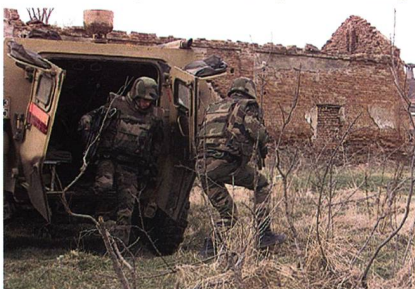
Feuerfeste Tarnbekleidung aus Kermel High-Tech-Fasern

Die spezielle Mischung aus Kermel®-Faser und Viskose FR ist ausserdem feuerbeständig und verleiht der daraus hergestellten Kleidung aussergewöhnlich guten Tragekomfort. Das Unternehmen garantiert eine gute Beständig-