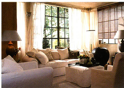
Textilien aus Securrelle® im Heimtextilbereich

geschäft und in der Wohnraumausrüstung bieten Securrelle®-Textilien jetzt zusätzlich: