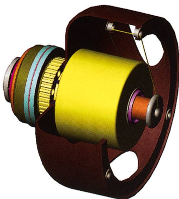
Verseilmaschine, rotierende Bauteile

Für technologisch führende Unternehmen spielen die innovative Entwicklung von Maschinen und deren effizienter Einsatz eine Schlüsselrolle bei der Sicherstellung und beim Ausbau der Wettbewerbsfähigkeit. Entscheidend ist, wie diese Unternehmen die Innovationen vorantreiben und in marktfähige Produkte umsetzen. Innovation zielt dabei zunächst auf verbesserte Wettbewerbsfähigkeit, daneben aber auch auf nachhaltige Produktion, d.h., auch auf die Schonung der Ressourcen und der Umwelt. Leichtbau und Dauerhaltbarkeit sind typische Eigenschaften von Bauteilen, die das Erreichen solcher Ziele ermöglichen.