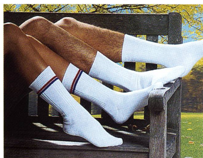
Bequem, funktional und antimikrobiell: Socken aus Trevira Bioactive

Das Spiel des Lichts, das Spiel zwischen Natur und Technik, zwischen Tradition und Modernität lassen die Farben facettenreich und neu erscheinen. Metallisch schimmernde Farben, die wie Gold, Silber oder Kupfer wirken, wech-