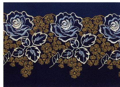
Innovatives Design für Spitzen aus Trevira Classixx von Soulis Kuehnis

Metallisierende Oberflächen, Beschichtungen, High-Tech-Garne, Matt/Glanz-Effekte, Sa-