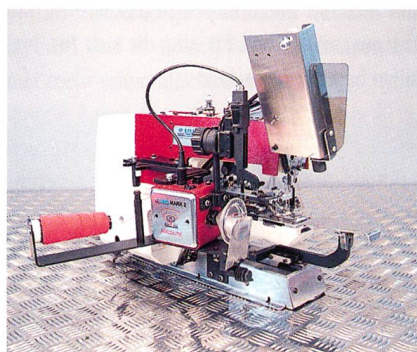
Knopfstiell Indexer Mark 12

Knöpfe befestigen und Knöpfe sichern – das ist die Zielsetzung der Firma Ascolite AG aus Erlenbach. Von jeher war es das Bestreben der Firma, der Bekleidungsindustrie die besten und rationellsten Systeme der Knopfsicherung zur Verfügung zu stellen. Seit Einführung der thermofixierbaren Knopfstiellumwicklung im Jahr 1995 verwenden weltweit unzählige Mode- und Be-