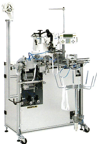
Nähautomat HS 972