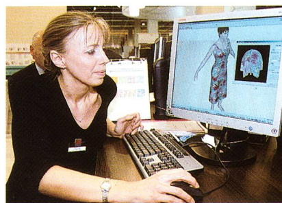
Schnittkonstruktion am Computer

Wichtiges Arbeitsmittel ist dabei eine Spritzpistole, mit welcher das Reinigungsmittel auf das Material aufgesprüht wird, und eine entsprechende Absaugung. Je nach Einsatzgebiet und Anforderung stehen verschiedene Grössen zur Verfügung. Speziell für die Bereiche Modehäuser und Hotels sind in letzter Zeit neue und kleine Fleckenentfernungsstationen entwickelt worden.