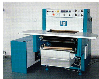
Presse PR 4 DH

Da ist beispielsweise das bügelfreie Hemd, welches wegen seiner hochausgerüsteten Oberstoffe sowohl nach speziellen Einlagestoffen, gleichzeitig aber auch nach auf die Anwendung ausgelegten Maschinen ruft. Freudenberg Gygli geht aber darüber hinaus und bietet auch Fi-