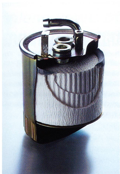
Abb. 2: Celanex PBT 2008 als Meltblown-Vliesstoff für die Kraftstofffiltration

Bereich ausgelegt ist. Dieser Medizin-Typ, Fortron PPS 9203HS, erfüllt alle wichtigen Zulassungskriterien für medizinische Anwendungen und den Lebensmittelkontakt (u. a. FDA Drug and Device Master Files, USP Class VI).