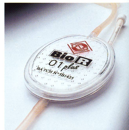
Abb. 1: Celanex PBT 2008 als Meltblown-Vliesstoff für die Blutfiltration

Neben dem vorgestellten Typ Fortron PPS 0203HS hat Ticona einen weiteren Fortron-Typen entwickelt, der speziell für den Healthcare-