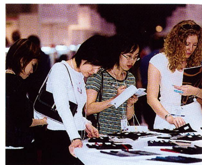
Interstoff Asia: Trends – immer gefragt bei den Besucherinnen

Der Rekord der Aussteller- und Besucherzahlen auf der Intertextile Shanghai 2002 vom 9. bis 11. Oktober im Shanghai New International Expo Centre, spiegelt das kontinuierliche Wachstum der chinesischen Wirtschaft wider.