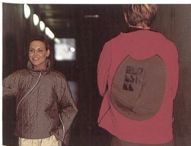
original soft-shells™ Modell der Fashion Design Class, Schule für angewandte Kunst Schneeberg

Der Top-Look der nächsten Saison kommt aus den wilden 80-ern. Schoeller-Stoffe haben den Retro-Look mit den Funktionen von 2004. Sehr authentische Längspikee-, Tweed- und rustikale Canvasoptiken blicken zurück. Wohlfühl-Funktionen der elastischen dynamic-Qualitäten mit Wolle und Baumwolle geben den Impuls nach vorne. Die Stoffe sind weich im Griff, der Finish ist sportlich, die Funktionen sind angemessen und deshalb umso wertvoller, bequeme Elastizität, hoher Tragekomfort, Langlebigkeit, UV-Schutz, Abperlfunktion und gute Waschwerte. In Kombination mit 3XDRY®