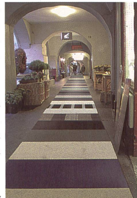
Der längste Teppich der Welt

Die Teppichfabrik Ruckstuhl visiert einen Weltrekord an: Sie hat den längsten Teppich der Welt hergestellt. Jede Mitarbeiterin/jeder Mitarbeiter der Einrichtungsgeschäfte teo jakob hatte sich aus dem vielseitigen Sortiment von Ruckstuhl ein Muster ausgewählt. Die etwa einen Quadratmeter grossen Teppichstücke wurden dann bei Ruckstuhl in Langenthal sorgfältig zu einem Riesen-Teppich zusammengefügt. Am letzten Freitagabend wurde das «Riesenstein» dann ausgelegt und akribisch vermessen: Ganze 146,40 Meter lang und 0,80 Meter breit war das Kunstwerk in den Lauben der unteren Berner Altstadt. Von Vorübergehenden und Interessierten bewundert, wurde der Teppich am späten Freitagabend wieder eingerollt und ist nun bis zum 27. Oktober bei teo jakob, Gerechtigkeitsgasse 36 in Bern zu sehen. Und dann wieder im neuen Guinnessbuch der Rekorde!