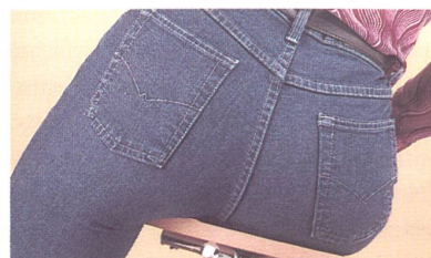
Länger frisch durch PURISA™