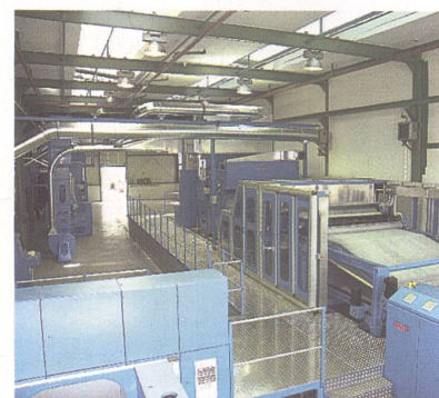
Viele Bearbeitungsstufen sind bis zu einem fertigen Vlies nötig. Hier in der Mitte des Bildes die sogenannte Krempel, die Vorstufe zum Vliesleger

«Vliesstoffe sind einzigartig konstruierte textile Flächengebilde, die kosteneffektive Lösungen bieten, nicht nur in der Automobilindustrie oder in der Teppichherstellung, sondern auch als Biovliese, im Strassenbau und der Umwelttechnik», so Werner Schlüter, zuständig für den internationalen Vertrieb bei Erko. Die Eigenschaften von Vliesen werden durch vier Hauptfaktoren bestimmt: