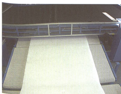
Bandabzug des Vlieslegers. Hier werden Vlieslagen bis zu einer Breite von 16500 mm kreuzweise übereinander gelegt.

In diesem Gerät stellt die Bewegungsführung der einzelnen Bänder, besonders deren sich laufend ändernde Relativbewegung zueinander, eine besondere Herausforderung an ein Automatisierungs- und Antriebssystem dar. Hier ist neben korrekt abzufahrenden Kurvenverläufen besonders die schnelle Kommunikation zwischen der Bewegungssteuerung und den einzelnen Servoantrieben gefordert, um takt-synchron (Signalaustausch in Millisekunden) zu steuern. Dazu kommt der Wunsch nach Fle-