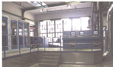
Ein Blick in das Technikum von Erko. Das Foto zeigt die Steuerung der kompletten Anlage

Der Textilmaschinenhersteller Hergeth Hellingsworth im westfälischen Dölmener fand es 1993 richtig, seine Elektroabteilung nebst Schaltschrankbau als selbstständiges Unter-