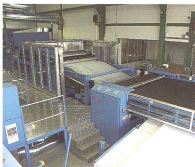
Der Vliesleger mit den Kreuzwagen.