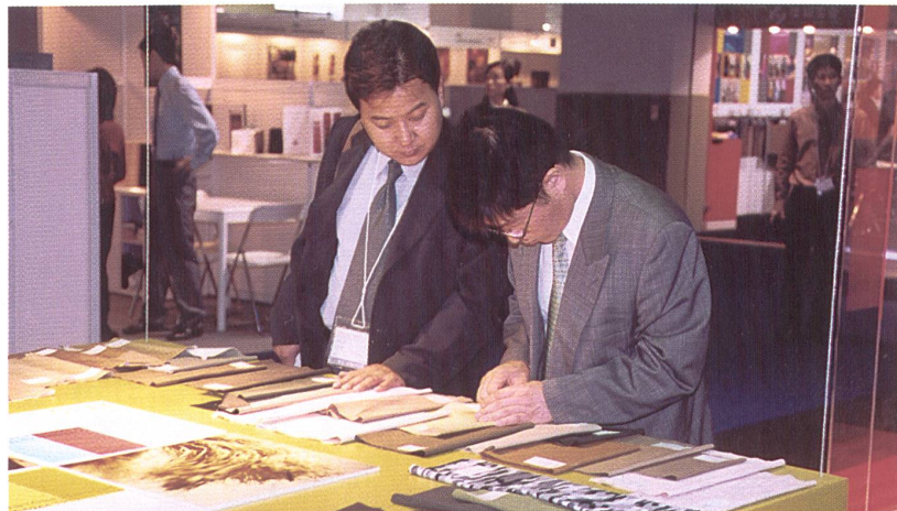
Impressionen von der Intertextile Shanghai Autumn, die vom 16. bis 18. Oktober in Shanghai, PRC, stattfand.

Die zweite Techtextil South America, Internationale Fachmesse für Technische Textilien und Vliesstoffe, knüpft nicht nur an den Erfolg der Premiere im Jahr 1999 an, sondern übertrifft ihn deutlich: 154 Aussteller aus 13 Ländern und 4'070 Besucher aus 23 Ländern, sorgten vom 6. bis 8. November 2001 für eine geschäftige Stimmung in den ITM-Expo Messehallen in São