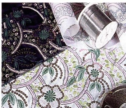
Abb. 2: Mustermöglichkeiten auf der neuen Stickmaschine

mit einer Breite von 1,5 m, getestet werden. Kleinstaufträge lassen sich auf der Era mit 60 Nadeln produzieren. Der Maschinenmix aus Hochleistungsmaschinen und flexiblen Kleinmaschinen, ermöglicht eine hohe Flexibilität und eine auf den jeweiligen Auftrag angepasste Produktionssteuerung. «Wir haben für jeden Auftrag die richtige Maschine», meint Geschäftsführer Thomas Leemann.