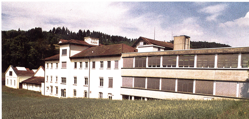
Das Produktions- und Verwaltungsgebäude der JHCO Elastic AG