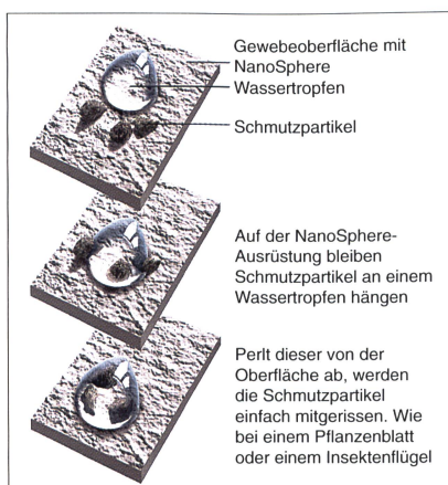
Abb. 1: Die Funktion des Nano-Finish

Parallel zu dieser Strukturbildung entsteht durch gelbildende Zusätze das Porensystem einer Membrane. Auf dieser dreidimensionalen Oberflächenstruktur kann sich Schmutz nicht festsetzen und Wasser wird abgewiesen. Das in der Schweiz entwickelte Verfahren entspricht