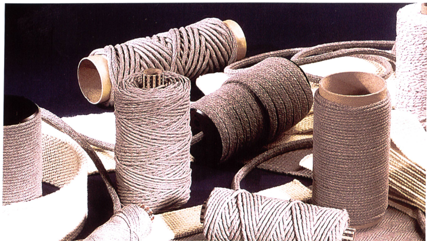
Wärmeisolationsfäden von Ferlam Technologies

Die im Auftrag der weiterverarbeitenden Industrie entwickelten Fäden finden äusserst