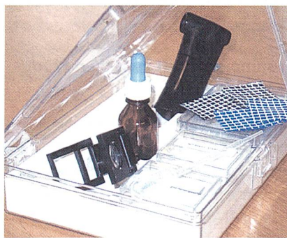
Kleines "Prüflabor" für den Aussendienst

nente Hydrophilausrüstung beinhaltet und von der Unterwäsche-Qualität bis zum Microfaser-Fleece zum Einsatz kommt. Die Mehrkosten stehen in vernünftigem Verhältnis. Wir rechnen mit 3 bis maximal 7 % Preisaufschlag," be-