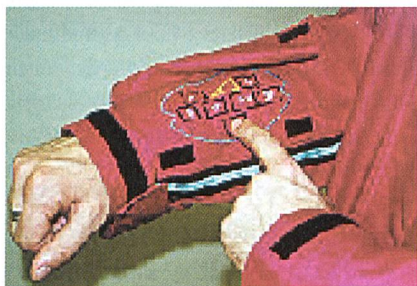
Abb. 1: Die Tastatur am Arm

"Die 'Soft-Switch'-Technologie ist faserunabhängig und kann theoretisch in Verbindung mit jeder beliebigen Textilkonstruktion eingesetzt werden", so Jones. Die Geräte sind waschbar, dauerhaft und zeigen ähnliche Eigenschaften wie konventionelle Textilien. "Die Technologie ist nicht nur für Bekleidungstextilien vorgesehen. Soft-Schalter können auch in Wände, Stühle, Fussbodenbeläge - also in alles was weich ist - eingebaut werden," meint Steven