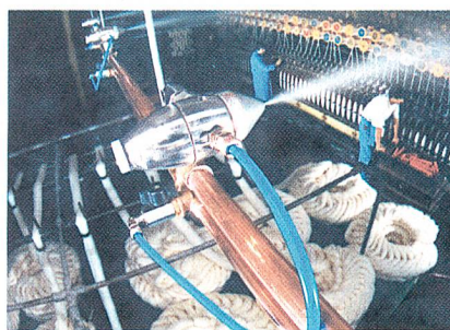
Das System JetSpray in einer Spinnerei

Das System JetSpray produziert mit Hilfe eines Präzisionsdüsensystems aus kaltem Wasser und mittels Druckluft feinste Flüssigkeitströpfchen