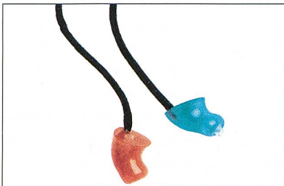
Abb. 2: Gehörschutz mit einer praktischen Kordel zum Umbängen

Die Filterwirkung eines Gehörschutzsystems ist so zu dimensionieren, dass der maximale Schallpegel am geschützten Ohr zwischen 75 und 80 dB beträgt. Überdämmung ist zu vermeiden, da sonst eine Beeinträchtigung der Wahrnehmung von Gefahrensignalen, Sprache oder anderen nützlichen Signalen die Folge ist. Der Träger eines Gehörschutzes mit Überprotektion kann sich von seiner Umgebung isoliert fühlen. Dies führt dann oft zum Ablegen des Gehörschutzes.