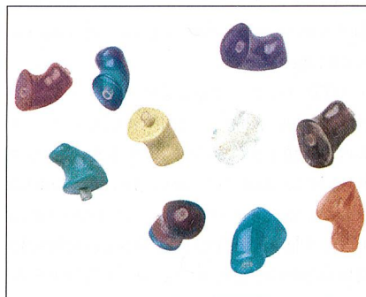
Abb. 3: Gehörschutz in vielen Farben

Eine Otoplastik, also das Ohrpassstück, wird individuell angefertigt. Dazu muss ein Ohrabdruck gemacht werden. Die Abdrucknahme ist ein vollkommen schmerzloser Vorgang, der direkt im Betrieb von einem Spezialisten oder durch einen autorisierten Akustiker gemacht wird. Nach einer Schallpegelmessung am jeweiligen Einsatzplatz wird die notwendige Schalldämmung festgelegt. Der Abdruck ist ein exaktes Negativ des Gehörgangs und von Teilen