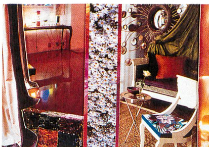
Heimtextil 2000 – Feuer

Den Projektwettbewerb für die Gestaltung des Schweizer Auftritts hat der «Erfinder und