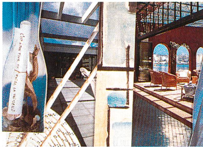
Heimtextil 2000 – Wasser

Gestalter Benjamin Thut» aus Zürich gewonnen. Er lädt die Messebesucher zu einer Wanderung durch die Textiltäler der Schweiz ein. Das Alpenpanorama der Schweiz – aus dem Blickwinkel von Frankfurt – wird auf beeindruckende Art und Weise auf der Messe präsentiert. Benjamin Thut verwendet zudem die für die Schweiz so typischen gelben Wanderwegweiser, die bereits am Haupteingang der Messe «die Richtung weisen». Ruhezonen – mitten im Messetrubel – und ebenfalls von B. Thut gestaltet, lassen den Messebesucher die Schweizer Bergwelt hautnah erleben. Diese Kleinstoasen informieren zudem über attraktive Ferienregionen und werden in Zusammenarbeit mit dem Tourismus Schweiz konzipiert.