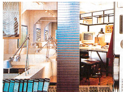
Heimtextil 2000 – Büro