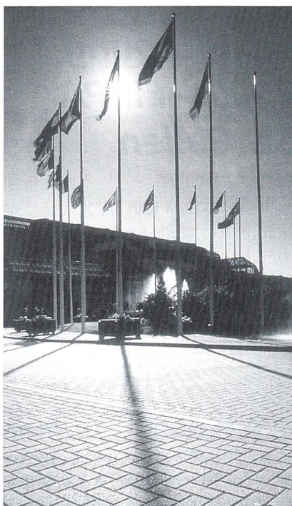
Flaggen begrüßen die Besucher aus aller Welt im NEC Birmingham