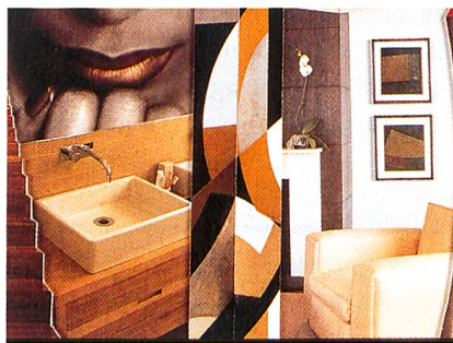
Heimtextil 2000 – Erde

Gestalter Benjamin Thut» aus Zürich gewonnen. Er lädt die Messebesucher zu einer Wanderung durch die Textiltäler der Schweiz ein. Das Alpenpanorama der Schweiz – aus dem Blickwinkel von Frankfurt – wird auf beeindruckende Art und Weise auf der Messe präsentiert. Benjamin Thut verwendet zudem die für die Schweiz so typischen gelben Wanderwegweiser, die bereits am Haupteingang der Messe «die Richtung weisen». Ruhezonen – mitten im Messetrubel – und ebenfalls von B. Thut gestaltet, lassen den Messebesucher die Schweizer Bergwelt hautnah erleben. Diese Kleinstoasen informieren zudem über attraktive Ferienregionen und werden in Zusammenarbeit mit dem Tourismus Schweiz konzipiert.